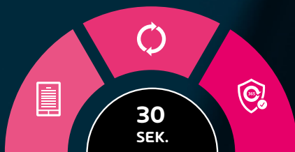
Abb.: Einfacher Onboarding-Prozess in drei Schritten

Mit 365 Total Protection schöpfen Sie das volle Potenzial Ihrer Microsoft Cloud Dienste aus.